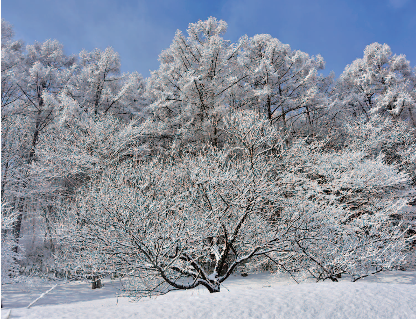
『寒い朝(雫石町)』